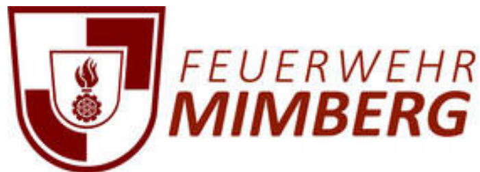
Neues Logo der FF-Mimberg

Neues Layout , neue Technik, aktuellere Informationen