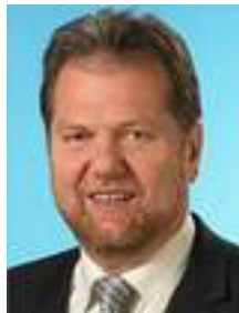
Erster Bürgermeister Gemeinde Burgthann

In diesem Sinne wünsche ich alles Gute für 2015 und ein paar ruhige und besinnliche Stunden zum Jahreswechsel.