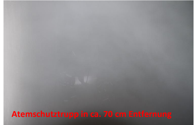
Atemschutztrupp in ca. 70 cm Entfernung

Doch wie sollen Feuerwehreute sich auf diese Situation vorbereiten, um im Ernstfall schnell und sicher handeln zu können. Hierzu finden in regelmäßigen Abständen Übungen für unsere Atemschutzgeräteträger statt. Diese gehen von einfachen Einsatzübungen zur Gewöhnung an die Geräte und die Atmung über den Lungenautomaten hin zu Belastungsübungen in der Atemschutzstrecke der FF-Feucht oder BF-Nürnberg. Weiterhin finden diverse „fallspezifische“ Übungen, wie zum Beispiel eine Rettung einer Person aus einem Silo im THW in Lauf statt.