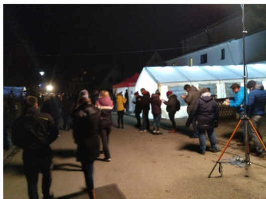
Feuerwehr Mimberg, ein starkes Team für Ihre Sicherheit