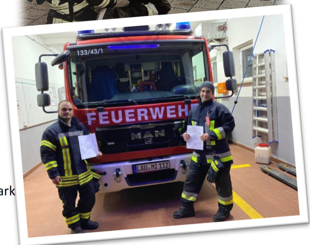
Feuerwehr Mimberg, ein stark